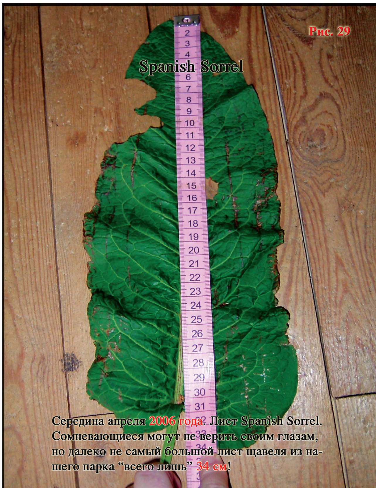
Середина апреля 2006 года. Лист Spanish Sorrel. Сомневающиеся могут не верить своим глазам, но далеко не самый большой лист щавеля из нашего парка “всего лишь” 34 см!