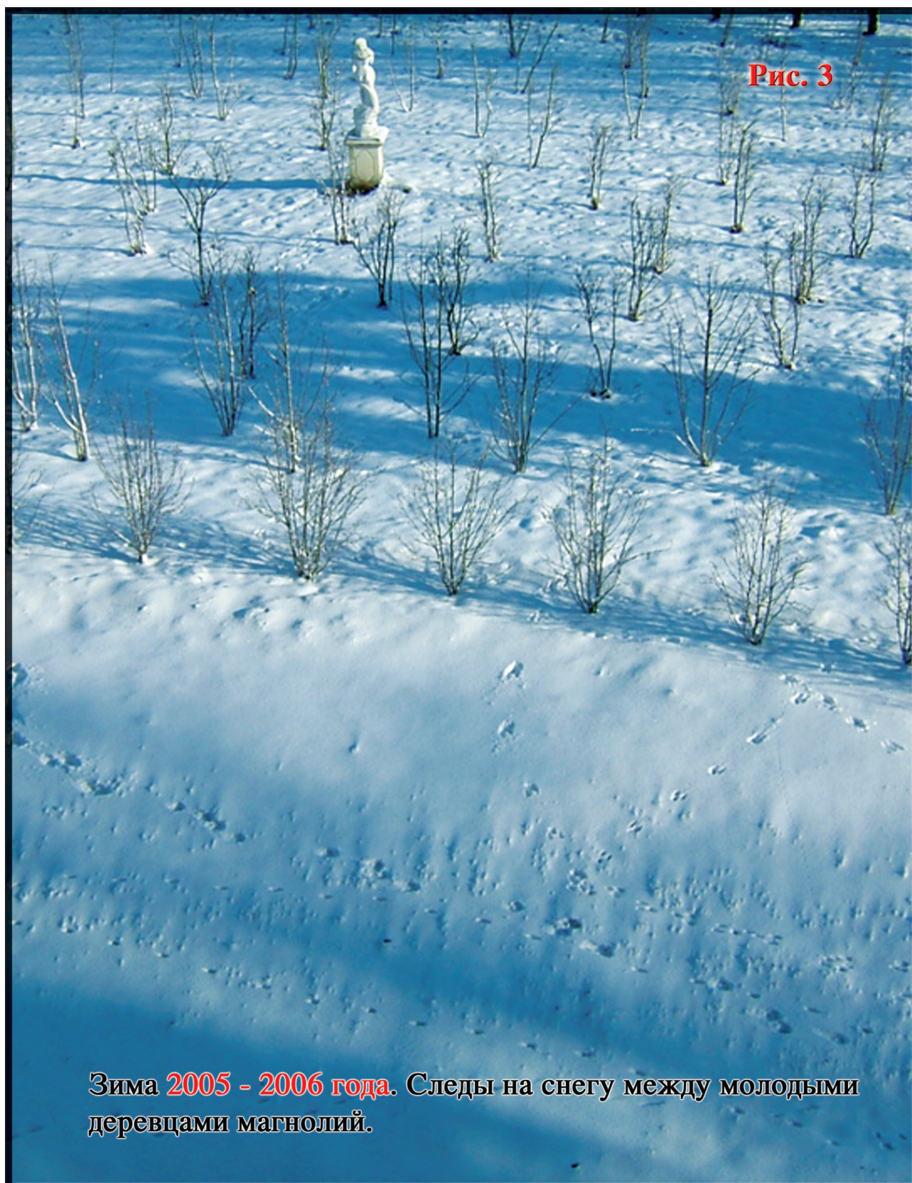
Зима 2005 - 2006 года. Следы на снегу между молодыми деревцами магнолий.