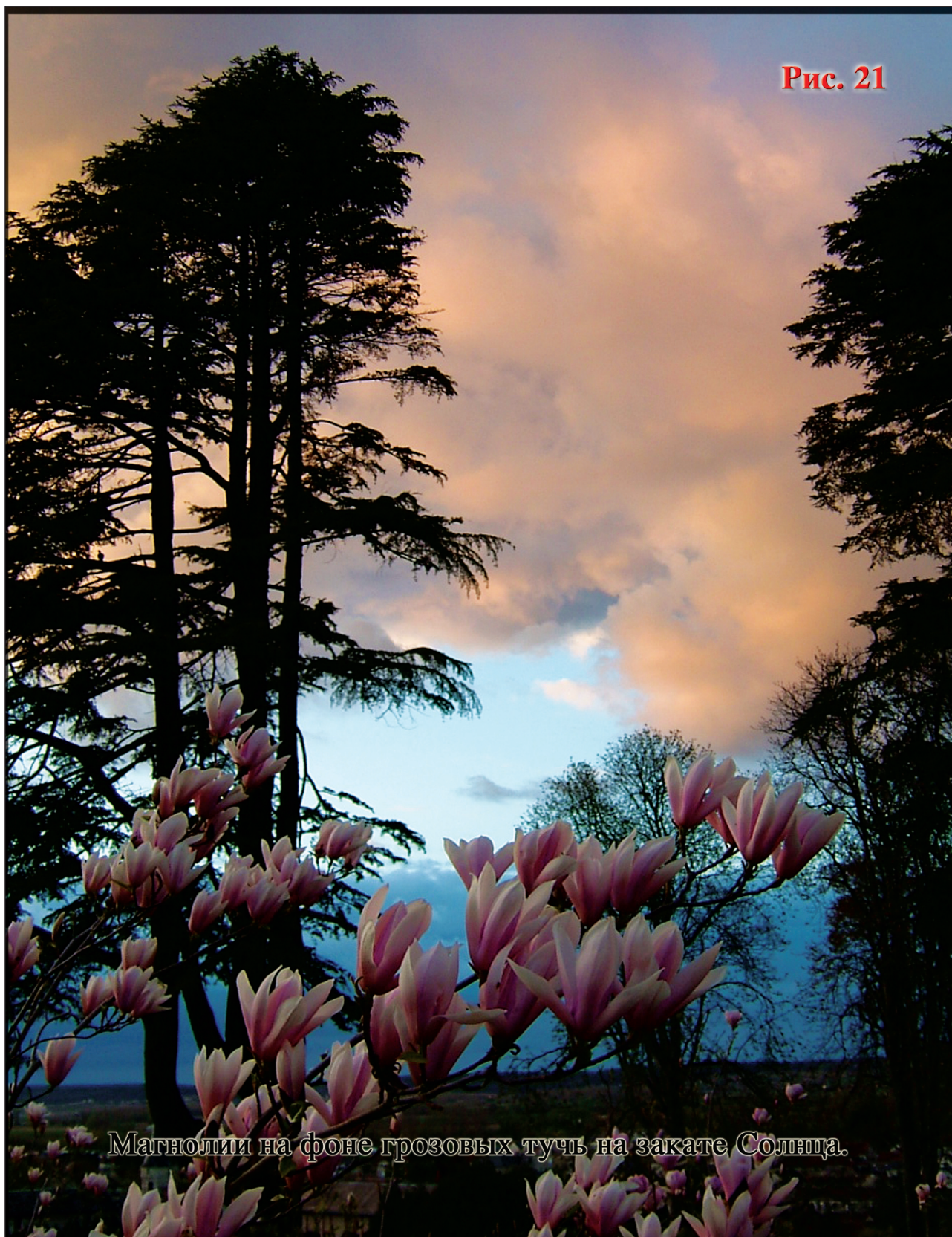
Магнолии на фоне грозовых тучь на закате Солнца.